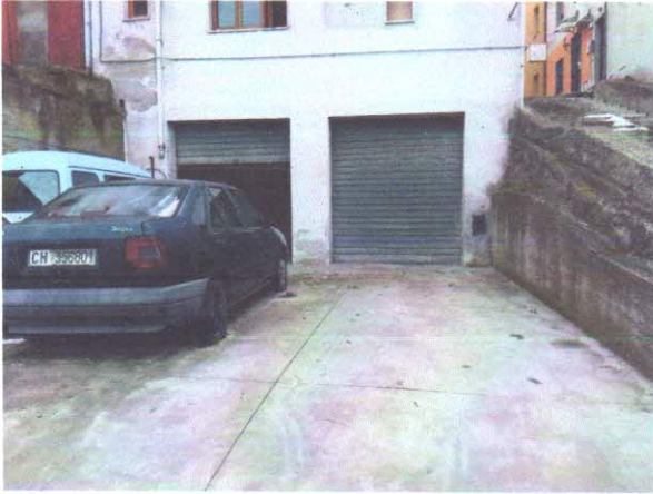
11 - INGRESSO AUTORIMESSA E AREA ESTERNA