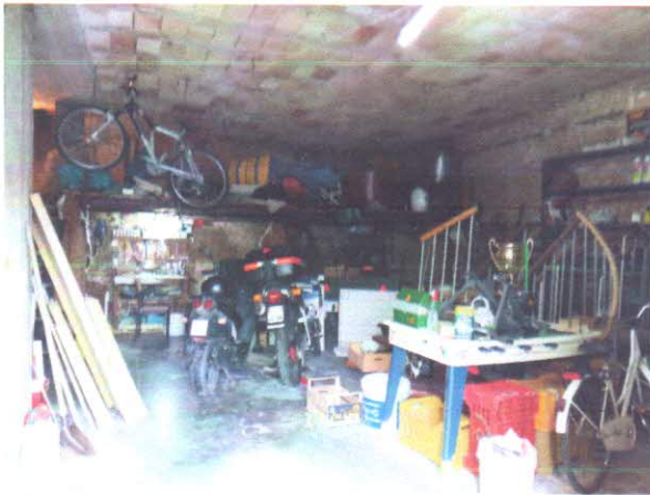
13 - INTERNO AUTORIMESSA