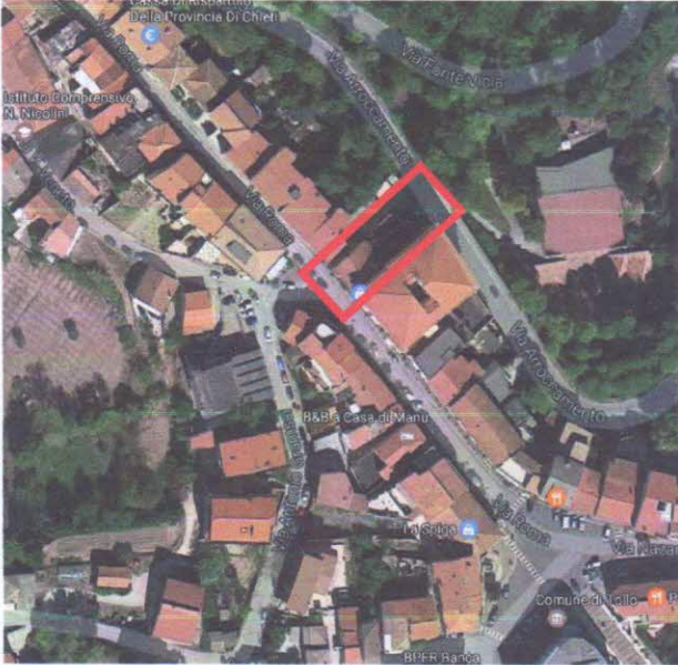
1 - INDIVIDUAZIONE IMMOBILE SU VISTA GOOGLE