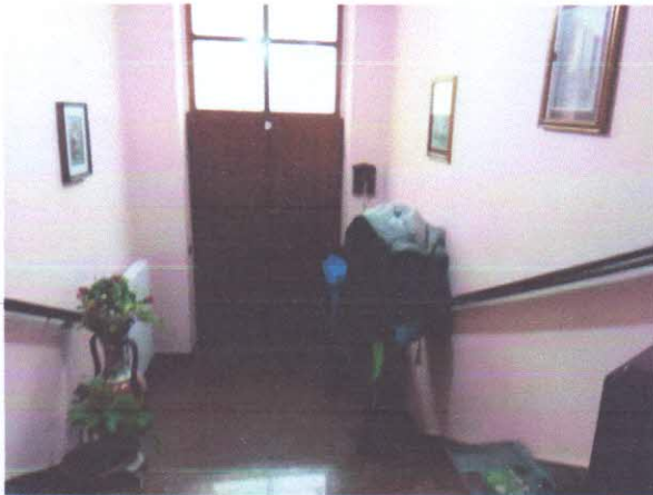
3 - INGRESSO ABITAZIONE