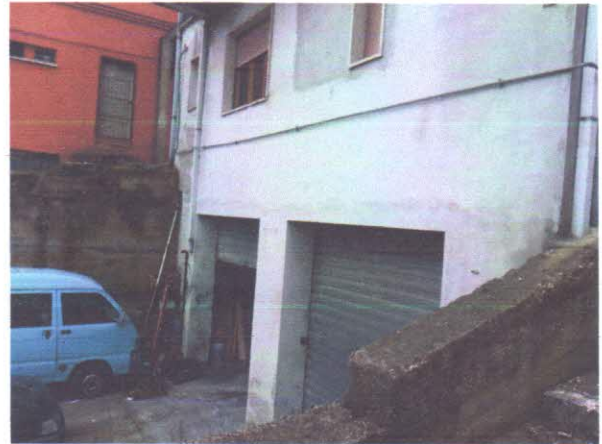
12 - INGRESSO AUTORIMESSA E AREA ESTERNA