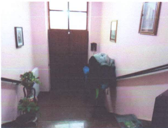
3 - INGRESSO ABITAZIONE