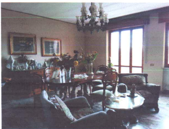
9 - SOGGIORNO