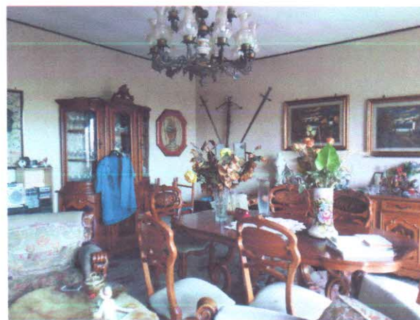
10 - SOGGIORNO