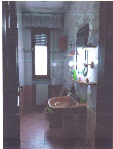
8 - BAGNO