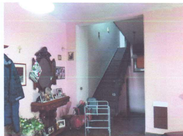
6 - DISIMPEGNO CON ACCESSO A SCALA DI ALTRA PROPRIETA'