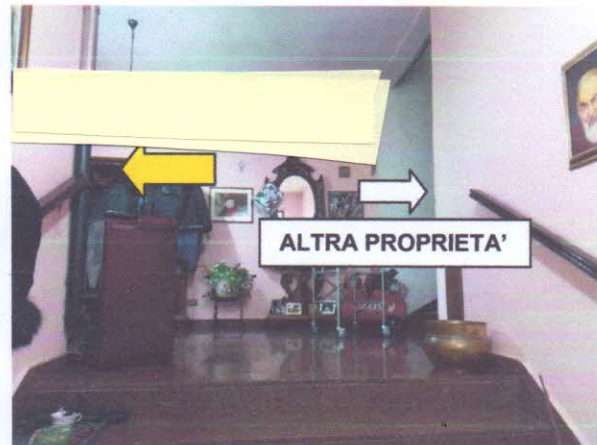
4 - PIANEROTTOLO INGRESSO ABITAZIONE