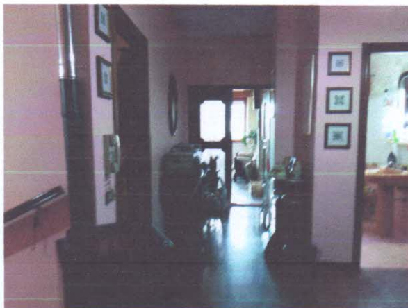
5 - DISIMPEGNO CUCINA/SOGGIORNO/BAGNO