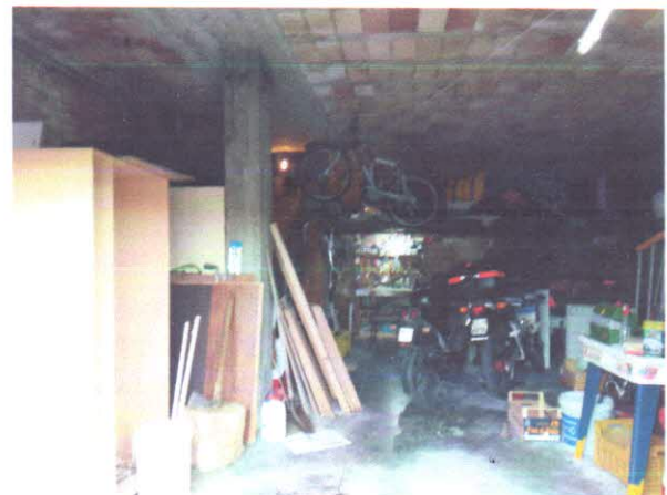
13 - INTERNO AUTORIMESSA