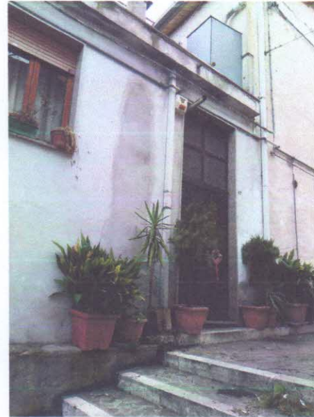
2 - INGRESSO ALL' IMMOBILE RESIDENZIALE